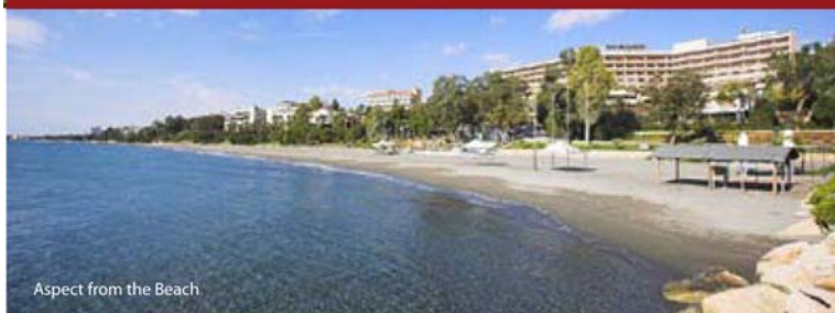
Aspect from the Beach

Двухуровневые пентхаусы на верхнем этаже оснащены ступенями, ведущими на крышу здания, где спроектирован сад с деревянными беседками. Здесь, наслаждаясь ошеломляющим морским пейзажем, можно воспользоваться частным бассейном, Джакузи и провести выходные с барбекю на крыше!