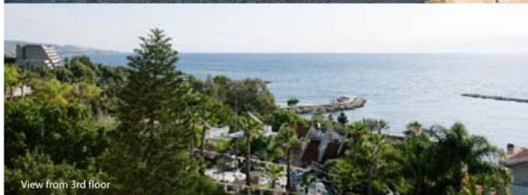
View from 3rd floor