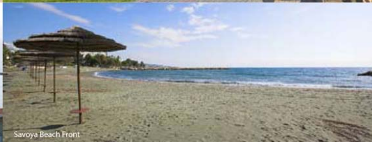
Savoia Beach Front